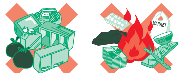
家電・ゴミの不法投棄 野焼き(家庭ゴミ・農業資材等)