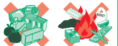
家電・ゴミの不法投棄 野焼き(家庭ゴミ・農業資材等)